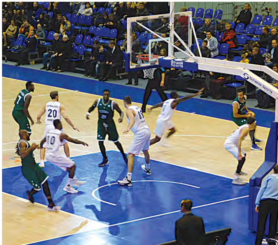
«Парме» не хватило до победы четырех секунд

Наставник ESSM Le Portel Эрик ЖИРАП , правда, почему-то на англий-