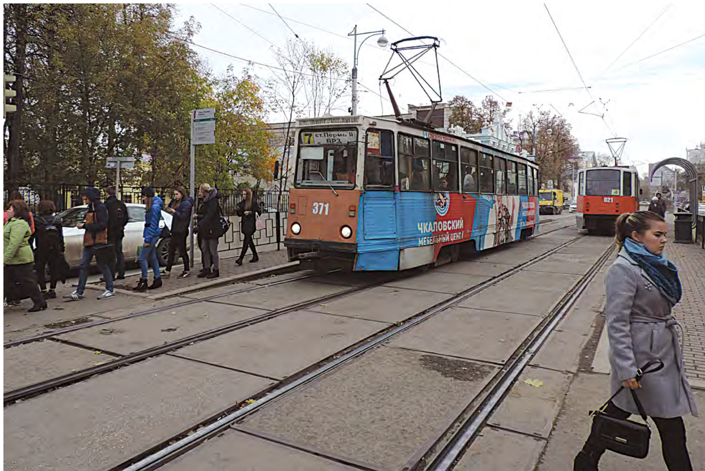
30 водителей трамваев остались без работы в Перми

транспорт объявлен приоритетным, в последние годы происходит сокращение выпускаемых на линию трамваев и троллейбусов. Так, в сентябре 2017 года на трамвае 10-го маршрута выпуск на линию в будние дни сокращен с 9 до 4 вагонов, а по выходным дням — с 8 до 2-х. Увеличились